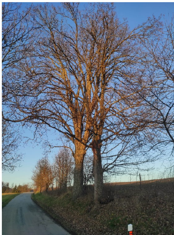
Javor klen vedle předchozího na zkratce od Němčic do Žďáru od rozcestí k rybníku „Starý“ ve směru na Žďár nalevo.