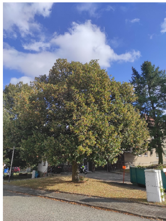
Lípa malolistá č. 1 u Hasičky