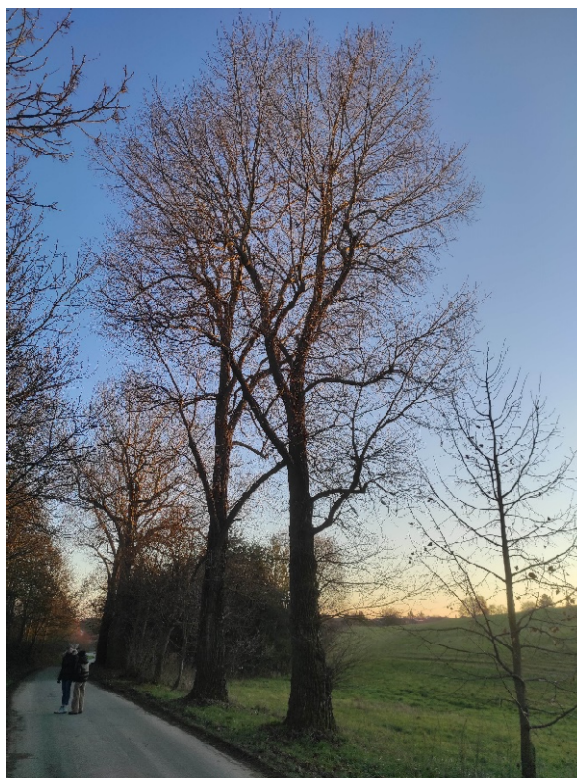
2 ks topolů kanadských na zkratce od Němčic do Žďáru od rozcestí k rybníku „Starý“ ve směru na Žďár napravo.