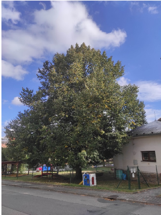
Lípa malolistá v zahradě mateřské školy.