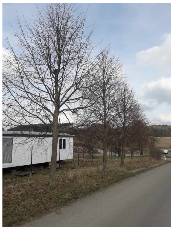
Lípy malolisté – druhý pohled – celkem 12 ks