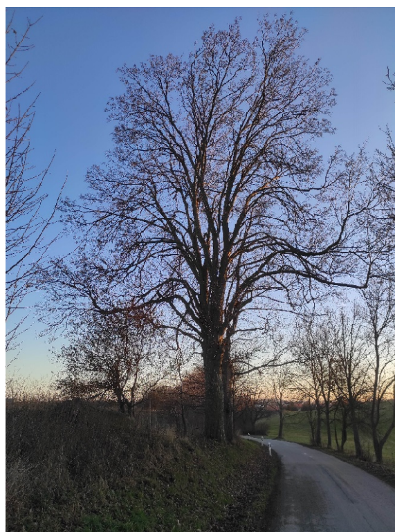
Javor klen na zkratce od Němčic do Žďáru od rozcestí k rybníku „Starý“ ve směru na Žďár nalevo.