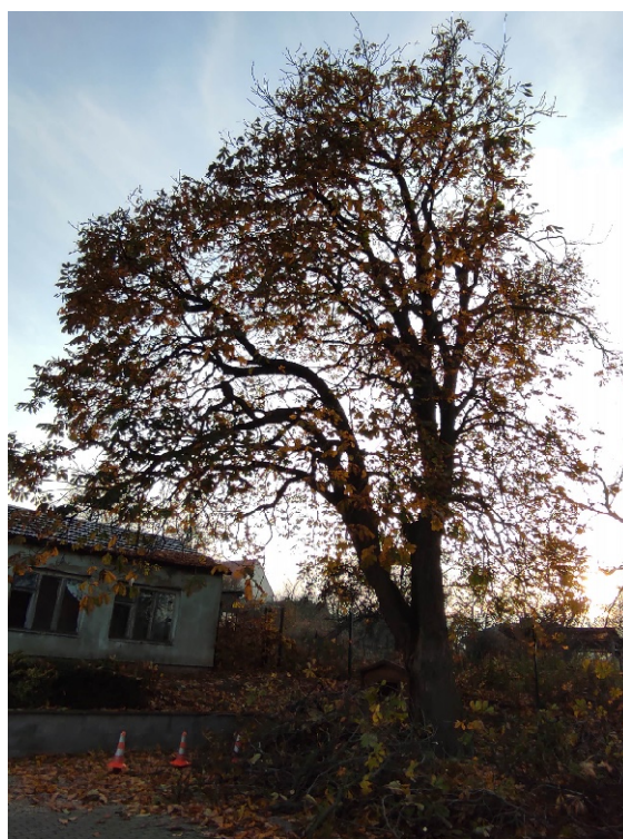
Jírovec madal u Dělnického domu