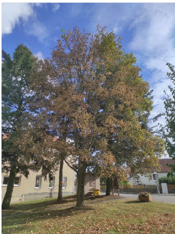
Lípa malolistá č. 2 u Hasičky