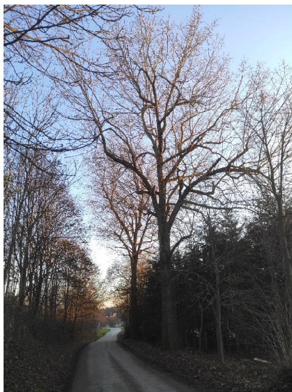
Topol kanadský na zkratce od Němčic do Žďáru od rozcestí k rybníku „Starý“ ve směru na Žďár napravo.