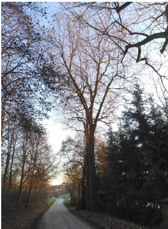
2 ks topolů kanadských vedle sebe na zkratce od Němčic do Žďáru od rozcestí k rybníku „Starý“ ve směru na Žďár napravo.