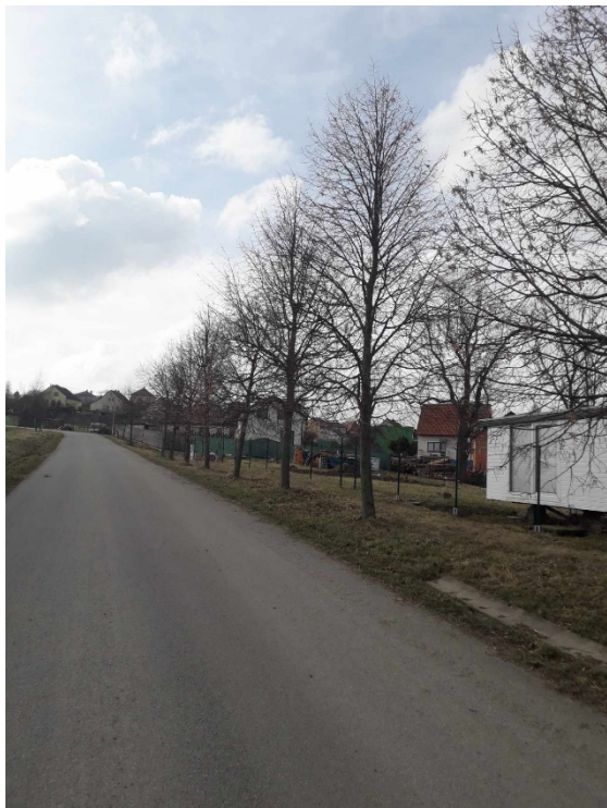
Lípy malolisté – první pohled - celkem 12 ks