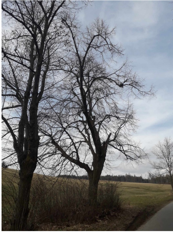
Lípa malolistá cesta na Němčice